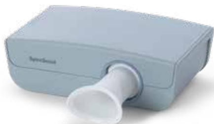
Spirometr ultradźwiękowy SpiroScout SP plus

Urządzenie CARDIOVIT CS-104 jest także dostępne jako oprogramowanie komputerowe do EKG spoczynkowego, z opcjonalnymi dodatkami do prób wysiłkowych i spirometrii.