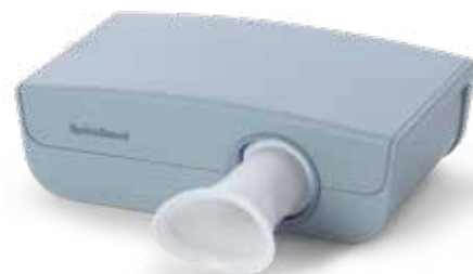
Spirometr ultradźwiękowy SpiroScout SP plus

Dzięki (opcjonalnemu) modułowi SpiroScout SP plus aparat CARDIOVIT FT-2 może się stać również spirometrem. Dzięki technologii ultradźwiękowej GANSHORN zapisy spirometryczne są bardzo dokładne, a sam czujnik nie wymaga konserwacji ani kalibracji. Opcja spirometrii oferuje parametry FVC, SVC i MVV z dużym wyborem standardów referencyjnych, testy przed podaniem i po podaniu leków rozszerzających oskrzela, jak również interpretację wyników FVC. Urządzenie dostarcza informacji zwrotnych na temat jakości procedury podczas badania oraz po każdej próbie. Dostępny jest ekran motywacyjny do badań wykonywanych u dzieci.