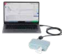
CARDIOVIT CS-104 Spiro