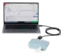
CARDIOVIT CS-104 Spiro