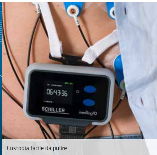
Custodia facile da pulire