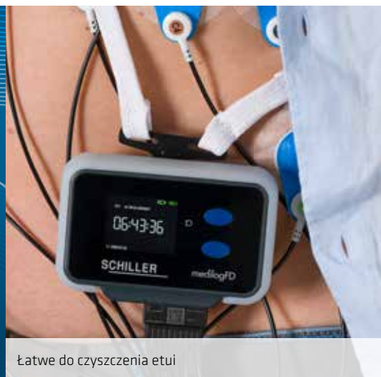
Łatwe do czyszczenia etui