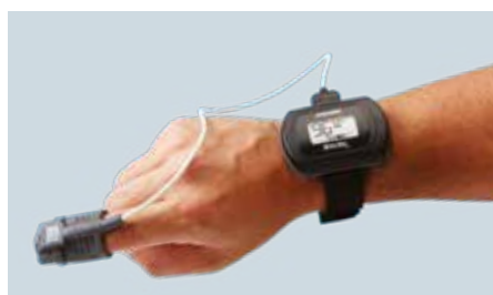
Bezprzewodowy czujnik SpO 2 zakładany na noc

Odłączany przewód pacjenta z 10 odprowadzeniami, przetestowany na ponad 4000 cykli połączeń